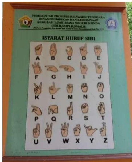
Gambar 3. Sistem Isyarat Bahasa Indonesia (SIBI)